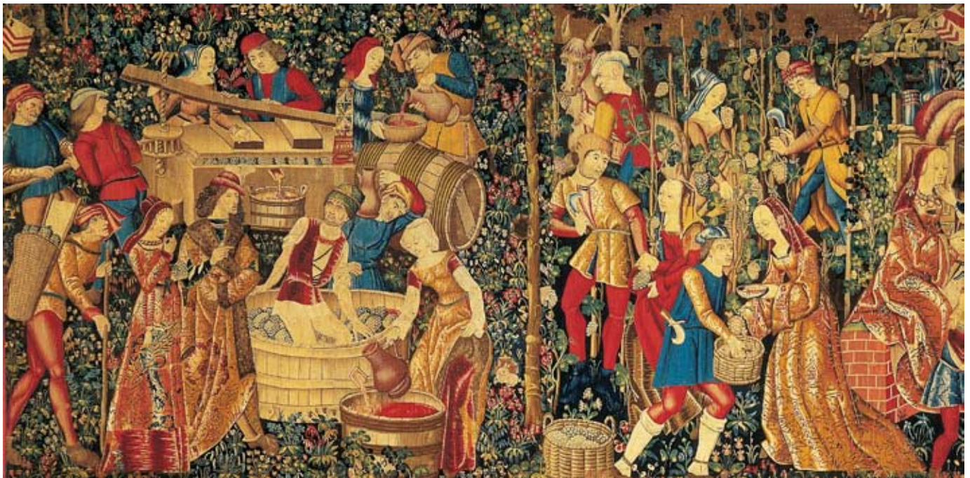
Tapisserie conservée au Musée National du Moyen Age - Thermes et hôtel de Cluny, Paris -

La date et la provenance de cette tapisserie dite « des vendanges » ne sont pas connues. L'examen des costumes conduit à penser qu'elle a été tissée au début du XVIème siècle. Dans son état actuel (dimension : 2,45 x 4,90 m environ), la tapisserie résulte de l'assemblage de deux parties distinctes dont celle de droite a été amputée. Les deux éléments se différencient d'une part par le fond : « mille fleurs » à gauche et paysage rural à droite, d'autre part par leur sujet : ici les vendanges, là l'élaboration du vin. Sur cette tapisserie, la perspective n'existe pas et les personnages ont tous la même taille bien qu'il ne soit pas tous sur le même plan (excepté un personnage dans le lointain).