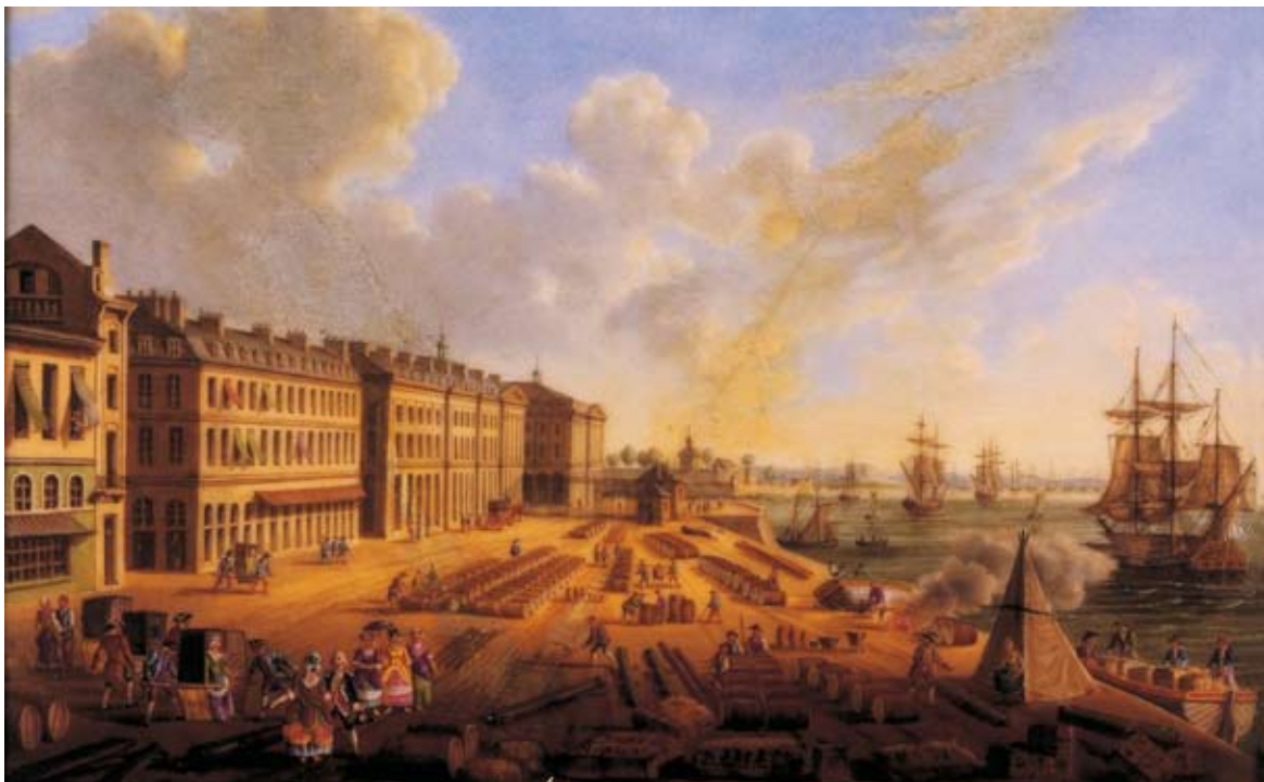
Miniature du XVIIIème siècle inspirée d'une gravure d'Ozanne - A. Beguerie pour Ed. L'Horizon Chimérique